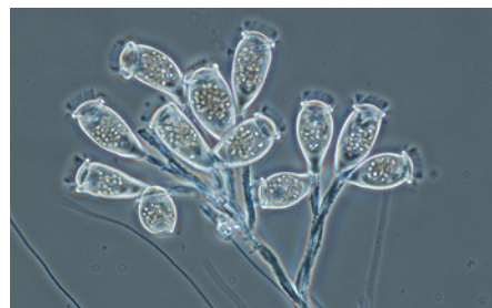
Los microbios como estos protozoos ciliados ayudan a eliminar las bacterias y el material orgánico del agua durante el tratamiento secundario.

¿Cómo sabemos que estamos haciendo un buen trabajo? Las plantas de tratamiento de aguas residuales están reguladas por el programa de permisos del Sistema Nacional de Eliminación de Residuos Contaminantes (NPDES, por sus siglas en inglés), de la Agencia de Protección Ambiental. Los permisos del NPDES establecen rigurosos estándares que el agua de la planta debe cumplir. La Asociación Nacional de Agencias de Agua Limpia ha otorgado a O'Brien WRP los más importantes galardones de la Asociación por el cumplimiento de estos estándares. También vemos los beneficios producidos por nuestro trabajo en una mayor actividad recreativa en las vías fluviales, como kayak y canotaje, la recuperación del hábitat acuático y aumentos en la cantidad de especies de peces. Estamos reduciendo el uso de energía en nuestras instalaciones, con el fin de reducir las emisiones de gases de efecto invernadero, y estamos recuperando valiosos recursos y expandiendo el uso de biosólidos en toda la región.