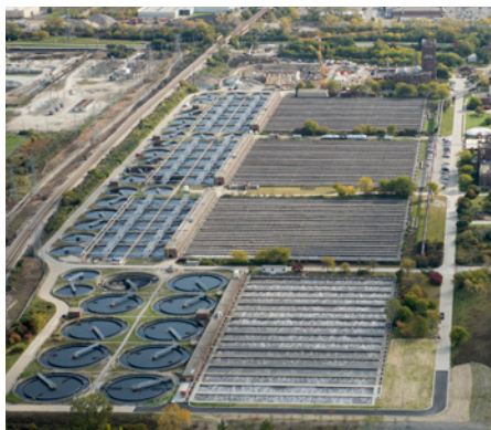
Planta de Tratamiento de Agua O'Brien

La Planta de Tratamiento de Agua Terrence J. O'Brien (WRP, por sus siglas en inglés) es una de las siete plantas de tratamiento de aguas residuales que posee y opera el Metropolitan Water Reclamation District of Greater Chicago (MWRD). El MWRD es la agencia de tratamiento de aguas residuales y manejo de aguas pluviales para la ciudad de Chicago y 125 comunidades del Condado de Cook. Trabajamos todos los días para mitigar las inundaciones y convertir las aguas residuales en recursos valiosos como agua limpia, fósforo, biosólidos y gas natural.